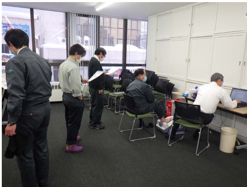
体組成、骨密度測定