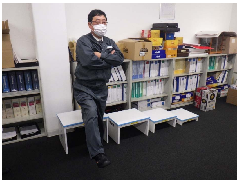
立ち上がりテスト