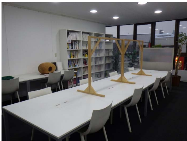
飛沫防止衝立（会議スペース）