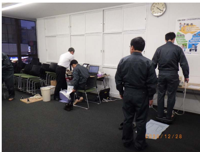
体組成、骨密度測定