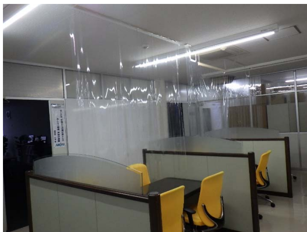
飛沫防止シート（打合せスペース）