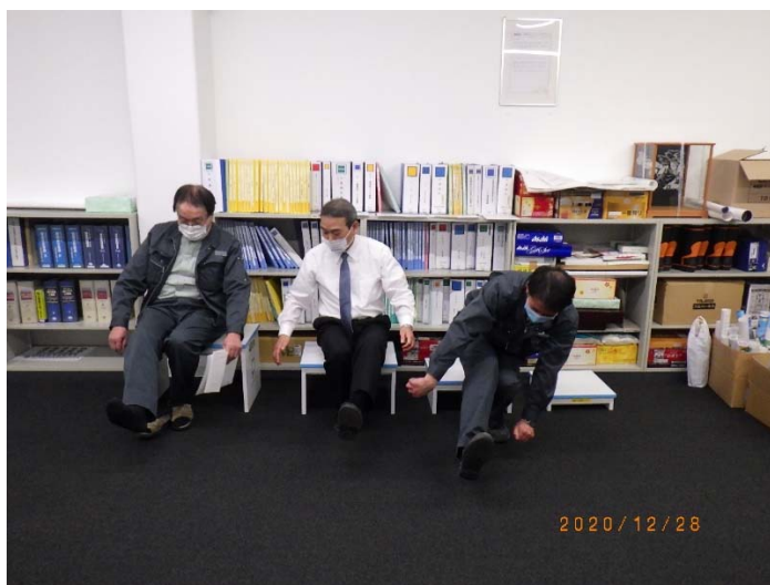
立ち上がりテスト