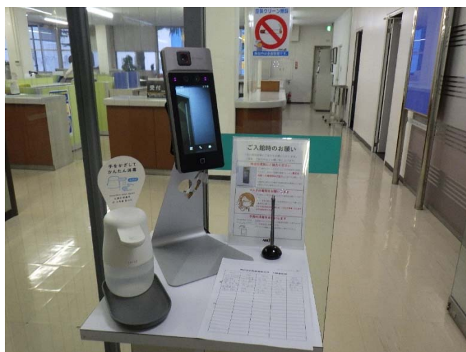
消毒液、顔認証型サーマルカメラ体温計、入館者記録

・新型コロナウイルス感染防止対策のため、お客様を含め社屋全入館者に対して入館者記録と検温、手の消毒、マスクの着用を徹底しています。また、全社員を対象に民間医療機関のPCR検査を会社負担で定期的実施し、社員の安全とお客様への安心感を提供するとともに、感染拡大防止に努めています。現場作業所においては、全入場者の検温、打合せ時等のマスク着用、手の消毒、休憩施設の換気を徹底しています。